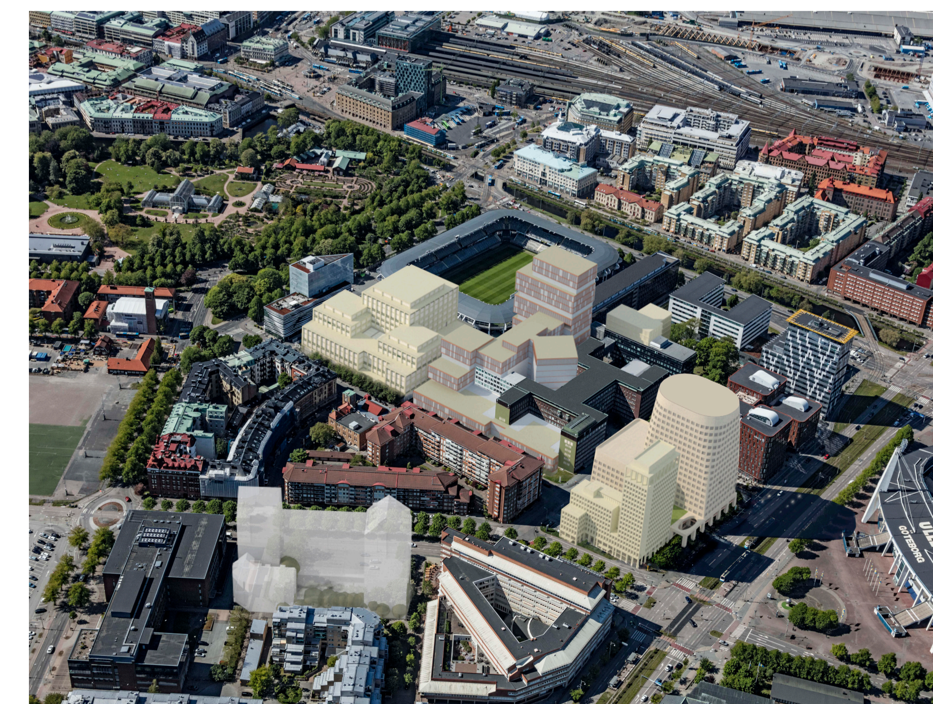
Illustration, Kanozi. Vy över området från sydost.